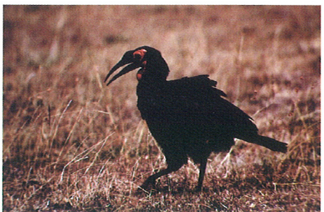
ミナミジサイチョウ