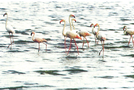
コフラミンゴ・オオフラミンゴ