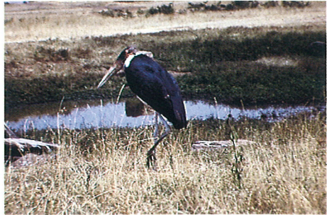
アフリカハゲコウ