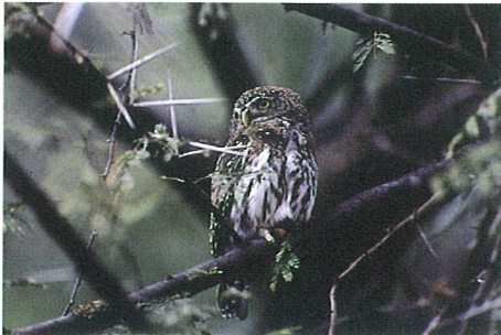
アフリカズメフクロウ