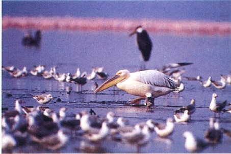
モモイロペリカン