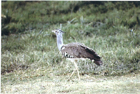
アフリカオオノガン