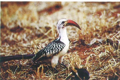
アカハシコサイチョウ