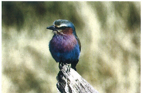
ライラックニシブツボウソウ