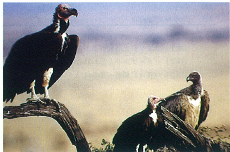
ベンガルハゲワシ・ズキンハゲワシ ミミヒダハゲワシ